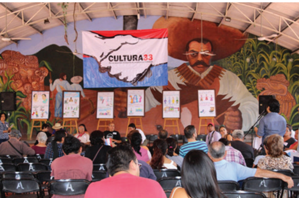
Asamblea General, 5 de agosto de 2018, Casa ejidal, Yautepec.

que artistas, creadores, promotores, gestores, emprendedores y grupos culturales han desarrollado, muchas veces en condiciones adversas. Su fortalecimiento y consolidación a través de la asignación equitativa de recursos financieros, materiales y humanos es indispensable para generar un verdadero desarrollo cultural.