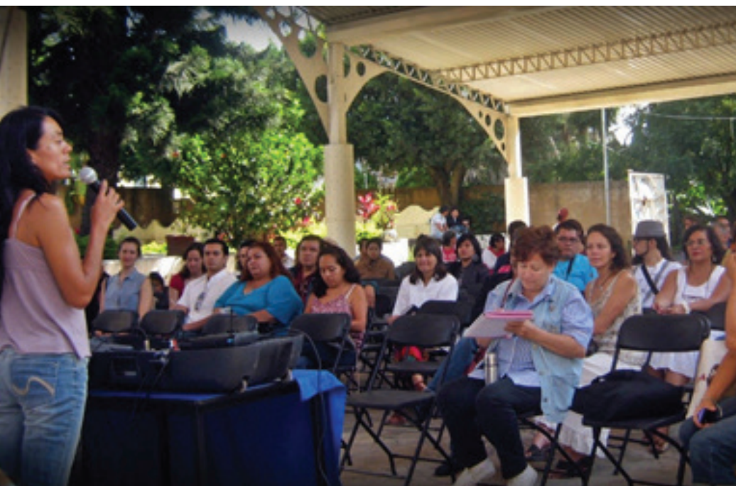
Reunión estatal, 14 de octubre de 2012, Casa de Cultura de Ixcatepec, Tepoztlán.

una comunidad cultural muy grande en los municipios que está exigiendo cosas. Por eso, siempre hubo tensión entre Cultura 33 y la banda de Cuernavaca, porque no había un entendimiento profundo de lo que significa tener estos privilegios, pero tampoco desde los municipios cómo podíamos vincularnos con ellos y generar sinergias.