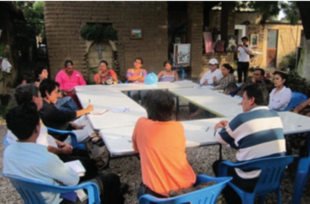
Foro de consulta, 2013, Yecapixtla.