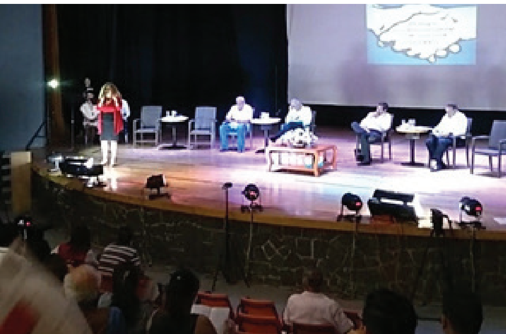
Dialogo por la Reforma Cultural, 6 de junio de 2018, Auditorio Ilhuicalli, Tepoztlán.

que tiene la nacional más lo que se viene en esta nueva Secretaría, la Ley va a someterse a otra nueva cirugía, y sabemos que eso significa trabajo, sabemos que eso puede dilatar también, pero tenemos ya experiencia. Creo que tendríamos que cada uno hacer un acto de reflexión para saber si vamos a refrendar, también se vale decir ya me cansé, a lo mejor también tendríamos que preparar nuevas estafetas.