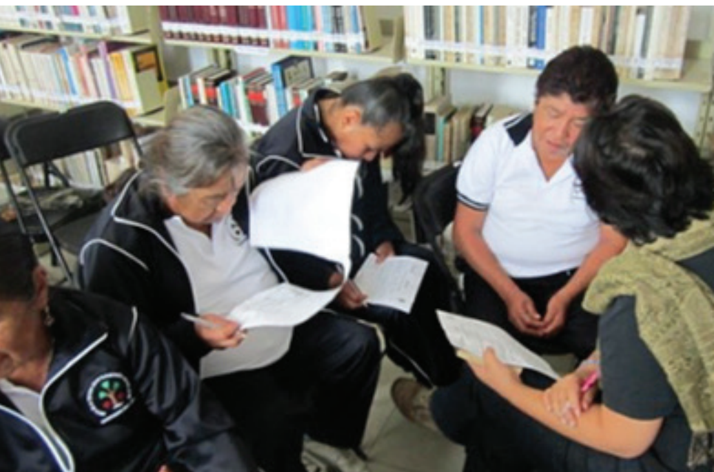
Foro de consulta, 2013, Tlalnepantla.