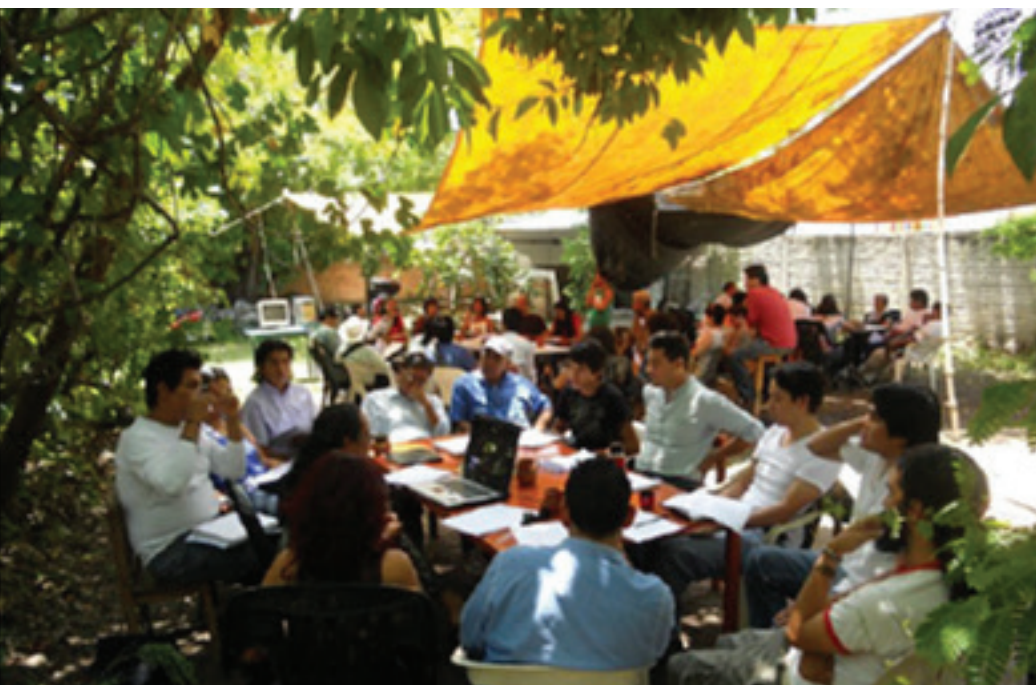
Reunión plenaria región sur, 29 de julio de 2012, Centro Cultural Yankuik Kuikamatilistli, Xoxocotla.

tas. Había una necesidad de hablar de todos los problemas, frustraciones, carencias, limitaciones, y la falta en que el Estado, porque eso lo tenían muy claro todos, el Estado tenía que resolver; era algo que a mí no me acababa de checar.