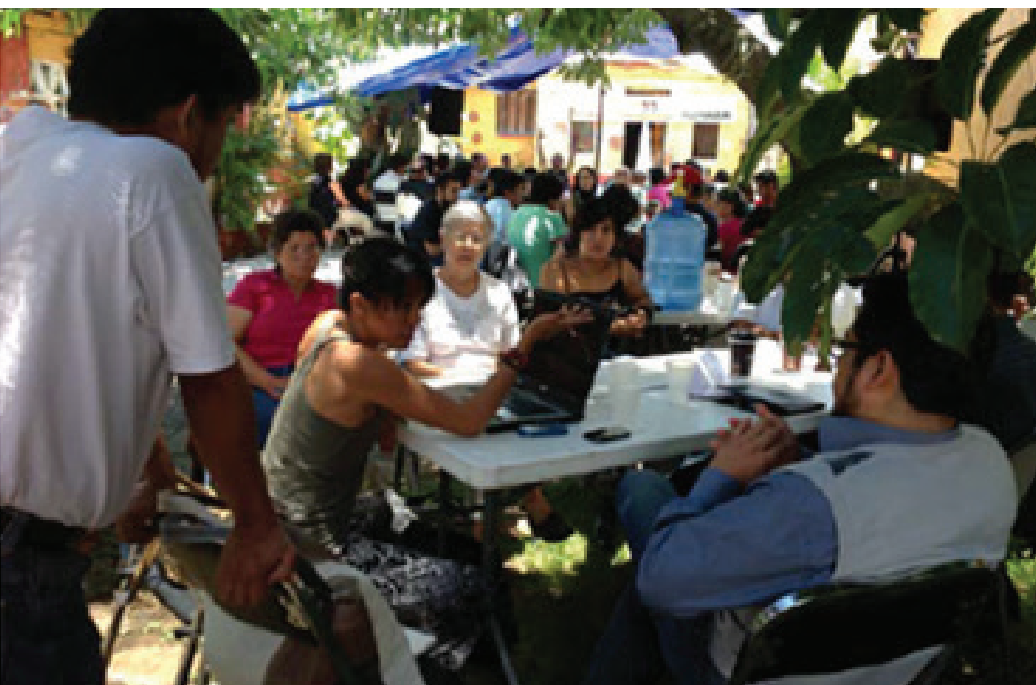
Reunión plenaria región oriente, 15 de julio, 2012 Centro Cultural El Callejón, Cuautla.

que fue el primer éxito, haber logrado que todo mundo se sentara y empezar los trabajos para la creación de una Ley, no la copia de una Ley, que era lo que se había estado presentando durante muchos años, que es lo que hacen rutinariamente los diputados. Y creo que eso fue lo que consolidó la posibilidad de que la Ley estuviera terminada, que pudieran estar todos trabajando, o que tuvieran intereses diferentes, pero un solo interés común, que era la Ley de Cultura.