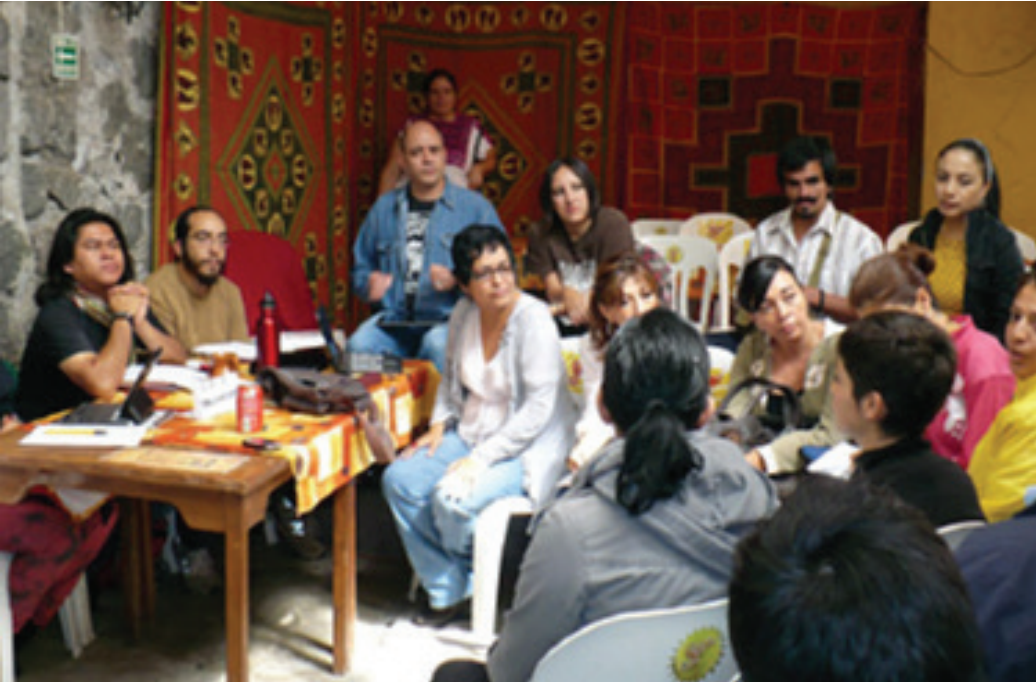
Reunión plenaria región norte-centro, 12 de agosto de 2012, Centro Cultural El Manojó, Cuernavaca.

seminario se hizo con muchos especialistas que tenían que ver con cuestiones de comunicación, cuestiones propias de la legislación, cuestiones de gestión cultural y varios temas que se trataron. Después de ese seminario, la idea era generar un equipo interdisciplinario de trabajo que estableciera una ruta, que nos llevara hacia la construcción de una Ley; y dentro de ese seminario, lo que se decidió es que primero había que hacer una consulta pública antes de generar un documento, que era una voluntad mucho más participativa, que generar un documento y luego consultar.