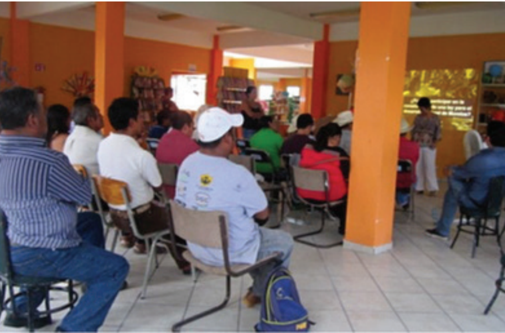
Foro de consulta, 2013, Atlatlahucán.

propuesta de Ley con la 53 va Legislatura.